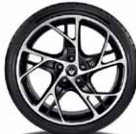
LESKLÉ ČIERNE A BRÚSENÉ 19" HLINÍKOVÉ DISKY