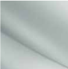
BIELA GLACIER (OV)