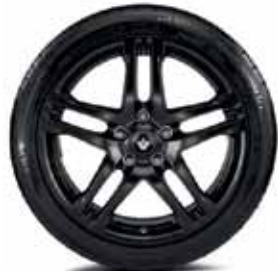
MATNÉ ČIERNE 18" HLINÍKOVÉ DISKY AX-L