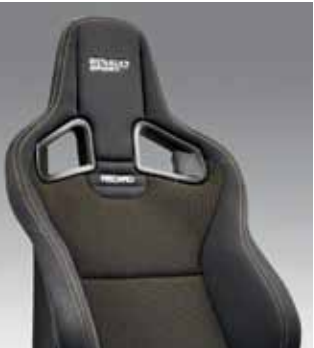
LÁTKOVÉ SEDADLÁ RECARO®