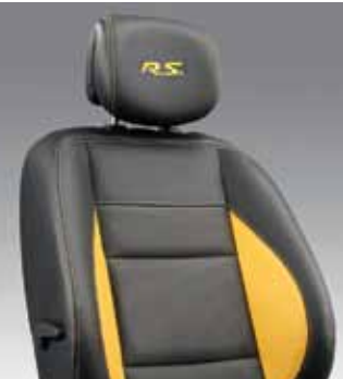
KOŽENÉ ČALÚNENIE ŽLTÝ INTERIÉR