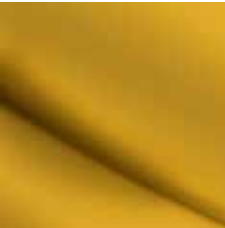
ŽLTÁ SPORT (OV)