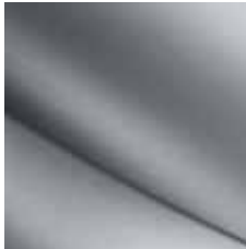
SIVÁ PLATINE (TE)