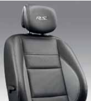
KOŽENÉ ČALÚNENIE SIVÝ INTERIÉR