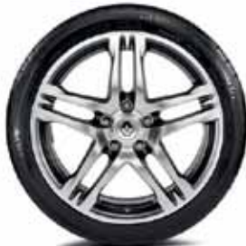
MATNÉ CHRÓMOVÉ 18" HLINÍKOVÉ DISKY AX-L