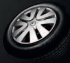
OKRASNÝ KRYT 15" SÉQUENCE