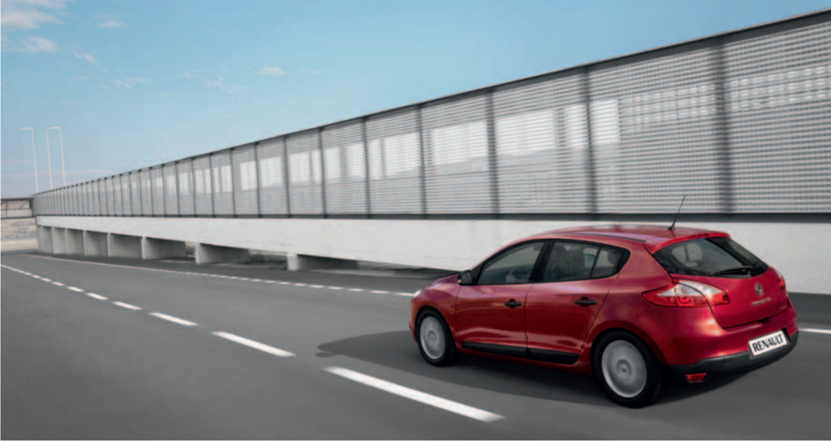
vyobrazenie vozidla je iba ilustratívne

Niektoré vozidlá strednej triedy sa spokojia len so splnením potrieb zákazníka. Renault Mégane Generation ponúka viac – je to moderné vozidlo so silným charakterom a aj napriek tomu mimoriadne prístupné širokej zákazníckej verejnosti. Jeho dynamický a robustný tvar naznačuje správanie spájajúce kontrolu, pohodlie a pocitovosť. Renault Mégane Generation sa cíti rovnako dobre na diaľnici, ako na kľukatých cestách. Vie skombinovať radosť z jazdy, priestor a štýl, čím čoraz viac zlepšuje každodenný život.