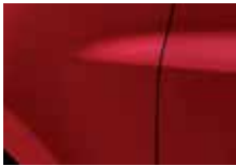
ČERVENÁ DYNA (NNJ)*