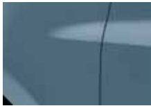
MODRÁ GRIS (J47)*