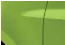
ZELENÁ POMME (DNQ)*