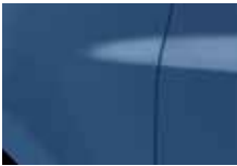
MODRÁ ETOILE (RNL)*