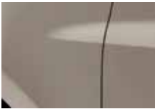
BÉŽOVÁ CENDRÉ (HNK)*