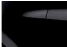
ČIERNA NACRÉ (676)*