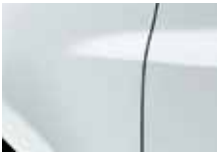
BIELA GLACIER (369)