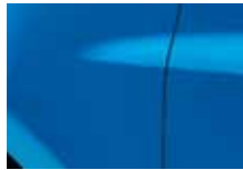
MODRÁ EXTRÉME (RNA)*