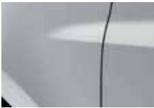
SIVÁ PLATINE (D69)*