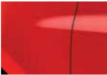
ČERVENÁ VIF (727)