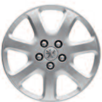
Puklica „Novae“ 16"