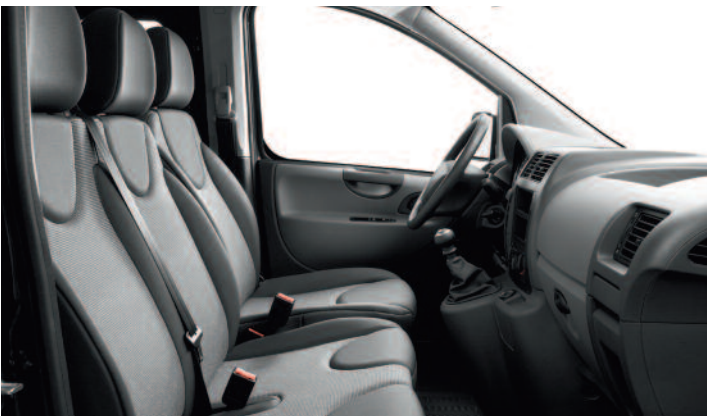
Látkový poťah Transcodage Narbonnais