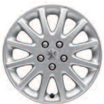
Hliníkový disk "Vivace" 16"