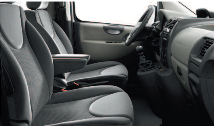
Poťah Sivá Narbonnais, zamat Jocaste

*Šírka s ochrannými lištami. **Šírka s vyklonenými spätnými zrkadlami.