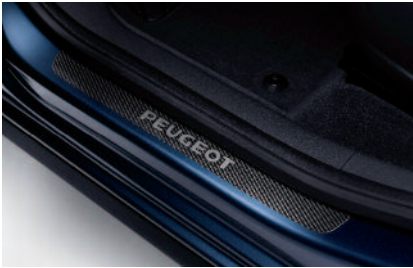
Chrániče prahov dverí v prevedení karbón

Chrániče prahov dverí Oba typy chráničov z PVC v prevedení karbón i z ocele sú estetickým a súčasne praktickým ochranným prvkom vášho vozidla 5008.