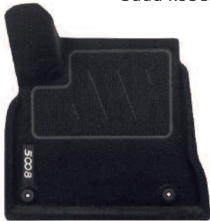
Sada koberčeka 3D

Sada koberčeka v spoľahlivo chráni podlahu vozidla. Sú vyrobené z kvalitných materiálov v rôznych prevedeniach.