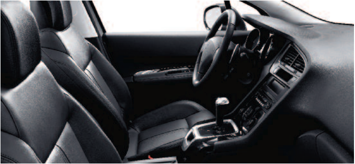
Koža čierna Tramontane* (voliteľná výbava)