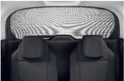
Zadné slnečné clony

Chrániče prahov dverí Oba typy chráničov z PVC v prevedení karbón i z ocele sú estetickým a súčasne praktickým ochranným prvkom vášho vozidla 5008.