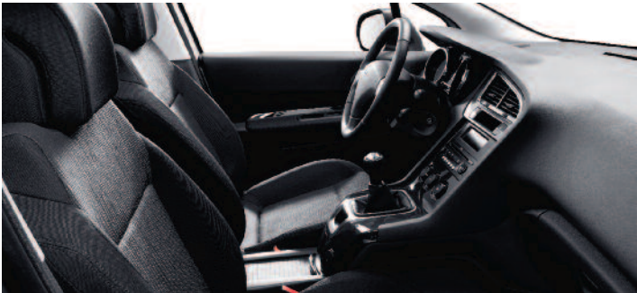
Tkanina Ligne čierna Tramontane