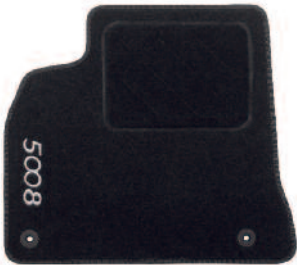
Sada velúrových koberčeka