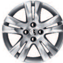
Zliatinový disk 17” QUARK