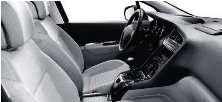
Tkanina Strada Guérande