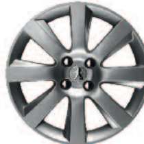
Zliatinový disk 18” MAGNETIK