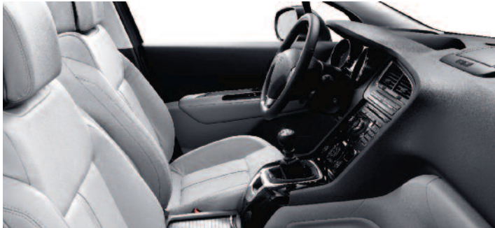
Koža sivá Guérande* (voliteľná výbava)