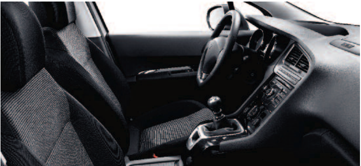
Tkanina Strada čierna Tramontane