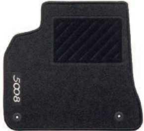
Sada textilných koberčeka s krátko strihaným vlasom