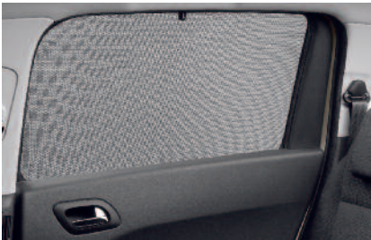
Bočné slnečné clony

Slnéčné clony Presne kopírujúce tvar okien, chránia pasažierov pred slnečnými lúčmi.