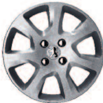
Puklica 16” HAUMEA