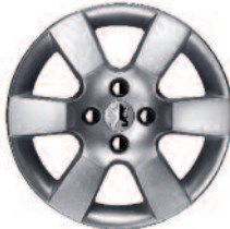
Zliatinový disk 16” ERISS