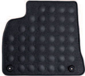
Sada gumených koberčeka