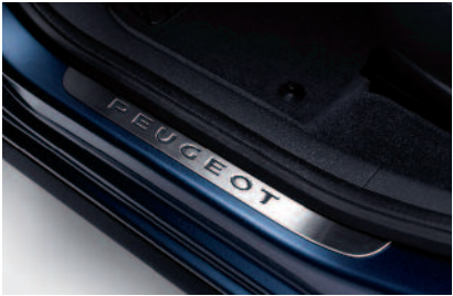
Chrániče prahov dverí z nehrdzavejúcej ocele

Sada koberčeka v spoľahlivo chráni podlahu vozidla. Sú vyrobené z kvalitných materiálov v rôznych prevedeniach.