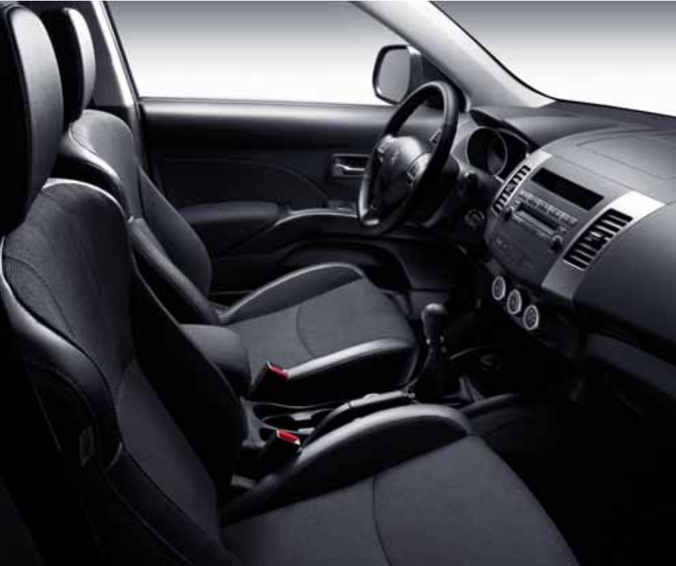
Pofah látka + koža pre úroveň výbavy Confort Pack a Executive