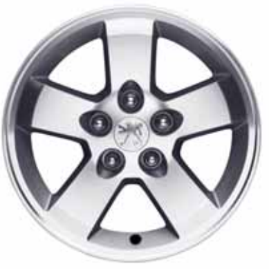
Hliníkové disky kolies 16" Manyara pre výbavu Executive