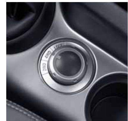
Manuálne ovládanie režimu pohonu.

Na snehu, piesku, blate a v náročnejších podmienkach je vhodné použiť uzávierku (4WD LOCK): v tomto režime systém prenáša až 1,5 násobne viac krútiaceho momentu na zadné kolesá, ako v automatickom režime a pomáha vám prekonať náročné miesta pomalou jazdou.