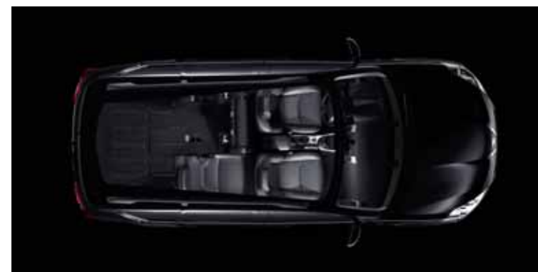
3 miestna konfigurácia