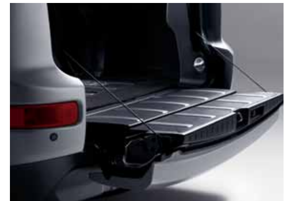
Sklápaceľné čelo podstatne zlepšuje prístup.