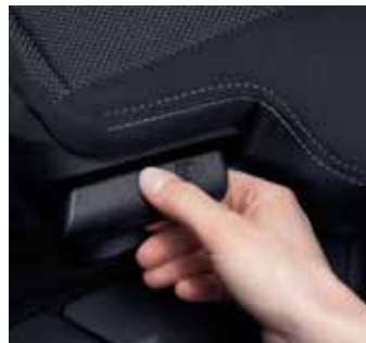
Na manipuláciu zadného sedadla slúži ovládací páčka.

Batožinový priestor začínajúci sa za druhým radom sedadiel poskytuje veľký objem. Je úplne pokrytý čiernym kobercom a uzatvára sa krytom. Pri sklopenom druhom a treťom rade sedadiel je jeho objem 1 686 litrov/VDA.