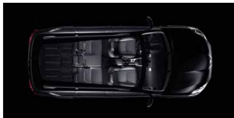
5 miestna konfigurácia

Okrem toho môžete zvýšiť počet cestujúcich na 7 použitím zasúvateľnej lavice umiestnenej v podlahe batožinového priestoru od úrovne Executive.