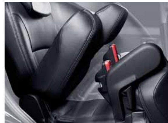
Sedadlá vzadu možno posúvať, nakláňať a sklápať.