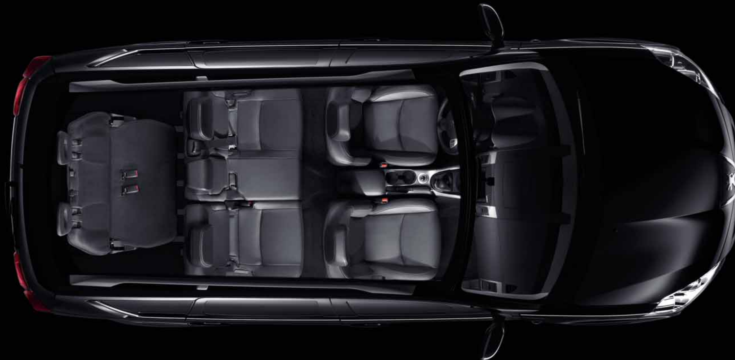
7 miestna konfigurácia