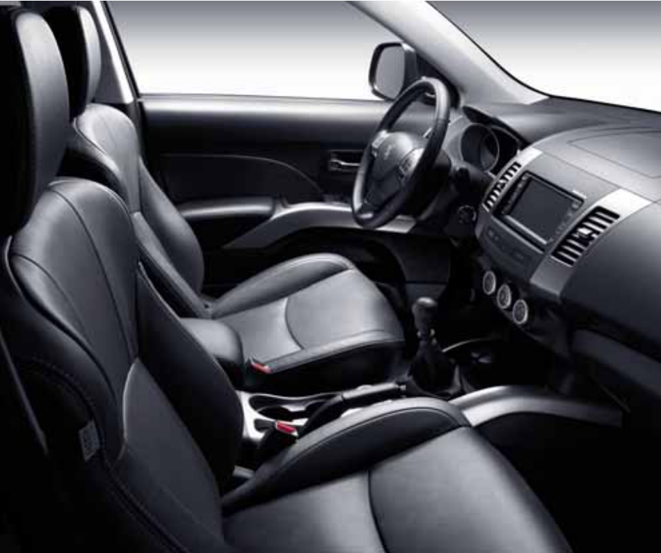
Kožený pofah sedadiel pre úroveň výbavy Executive Pack