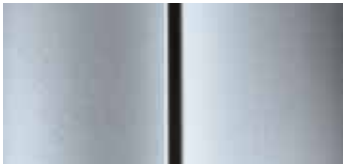
Sivá Cool Silver