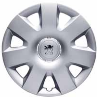
Okrasný kryt kolies pre 16" plechové disky pre výbavu Confort Pack