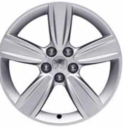
Hliníkové disky kolies 18" Tanganiyka pre výbavu Executive Pack

Prezrite si každý detail Peugeotu 4007. Objavujte, ako bol skoncipovaný: zvonku i zvnútra, jeho riadiaci modul i miesta pre cestujúcich, aby ste aj v tom najmenšom detaile našli maximálnu spokojnosť, komfort a radosť. Vychutnajte si rafinovanosť výbavy, usporiadania a dekorácie, ktoré boli vyvinuté, aby bol váš život na palube ľahší a príjemnejší.