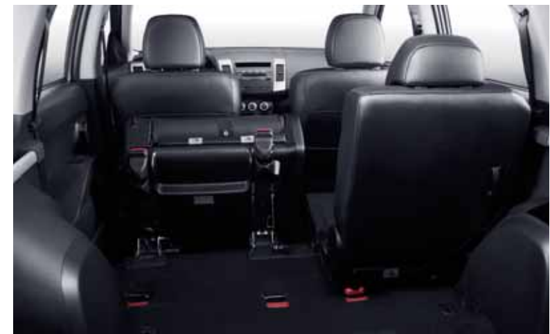
Sklápaceľné sedadlá v 2. rade.

v pozdĺžnom smere v rozsahu 80 mm a majú nakláňateľné operadlo, čo umožňuje transport batožiny a rôzneho materiálu potrebného na dlhšie výpravy. V batožinovom priestore je od úrovne Executive dvojmiestna lavica, ktorá sa sklápa do podlahy.