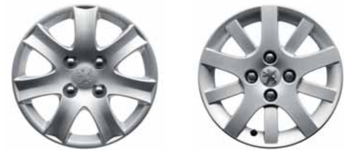
Puklica 14" Spa