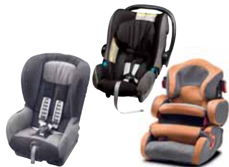
Detские bezpečnostné sedačky Testované a úradne schválené.