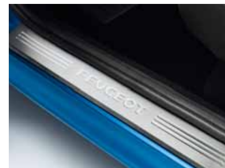
Sada hliníkových chráničov prahov dverí Dávajú nádych elegancie.