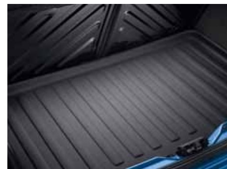
Vaňa do batožinového priestoru Vodeodolná a protišmyková.