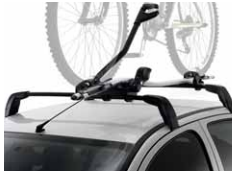
Uzamykatelný nosič bicykla Sedlom smerom nahor.