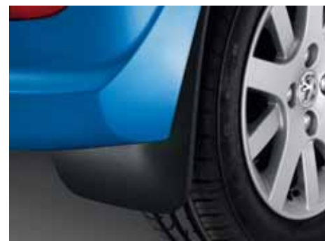
Sada štýlových zásteriek Zaisťujú ochranu a bezpečnosť.