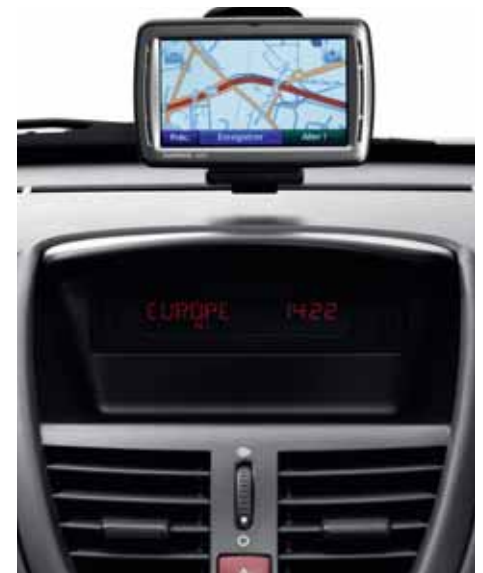
Navigačný systém Zadajte cieľ cesty a nechajte sa viesť.