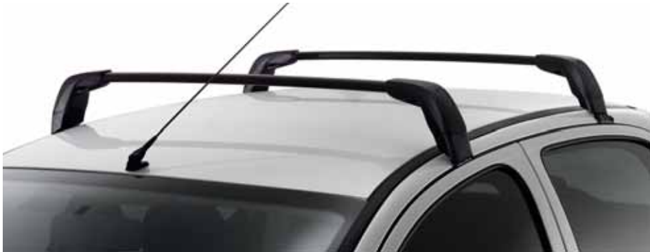
Strešný nosič Dovoľuje pripojenie série ďalších doplnkov, maximálne prípustné zaťaženie predstavuje 50 kg.

Nechajte sa zlákať na cestovanie S týmito praktickými doplnkami ste schopný pretvoriť Váš Peugeot 206+ na auto ako stvorené na cestovanie.