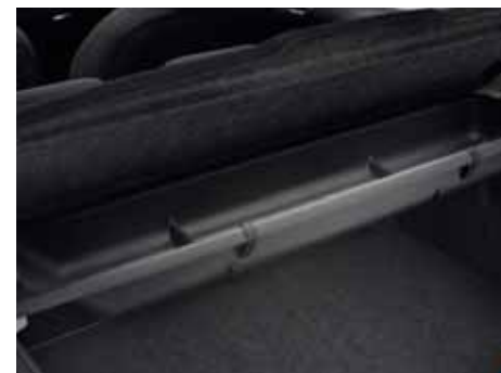
Priehradka pod kryt batožinového priestoru Používaná na uloženie rozličných predmetov.