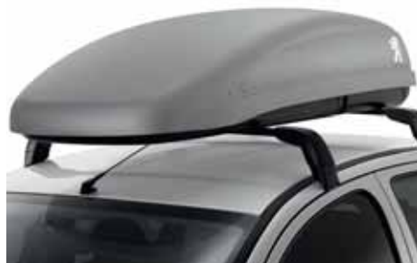
Strešné boxy Zvyšujú kapacitu batožinového priestoru.