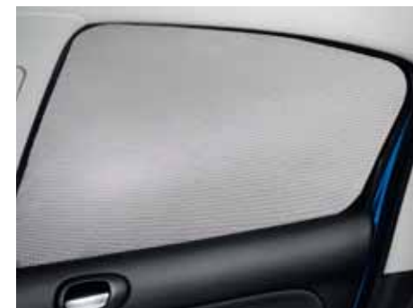
Slnéčné clony bočných dverí Pre úplné zatienenie bočných skiel.