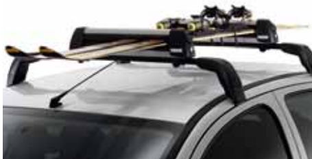
Nosič lyží s blokovacím systémom na strešný nosič Na štyri až šesť párov lyží.