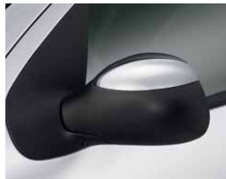
Súprava horných krytov spätných zrkadiel s chrómovým vzhľadom

2. Hliníkové disky Eveanys 14, 15 a 16" Dodajú športový a elegantný vzhľad.