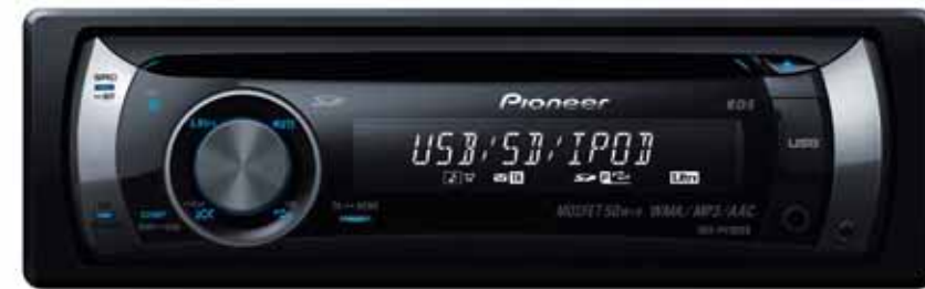
Autorádio Peugeot vám ponúka kompletnú ponuku rôznych značiek autorádií. Môžete si vybrať podľa vašich želaní.

Dnešné technológie vám môžu úplne zmeniť váš každodenný život. Nezaostávajú za ostatnými a profitujte z nich.