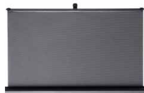
Zadná slnečná clona Chráni pred slnečným žiarením.