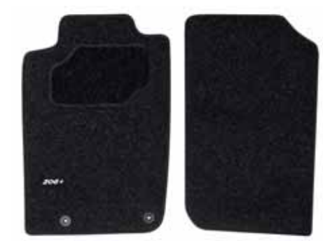
Sada predných a zadných kobercov Dostupné vo viacerých materiáloch (gumené, textilné).