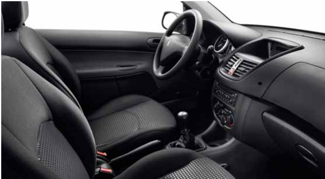
Potah látkový Chekmate Mistral