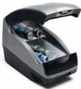
Izotermický modul Vybavený ohrievacími a chladiacimi funkciami.