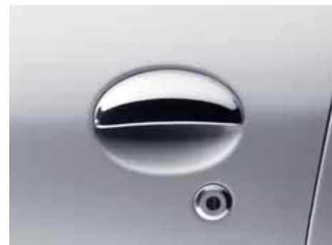
Súprava ozdobných krytov dverí s chrómovým vzhľadom