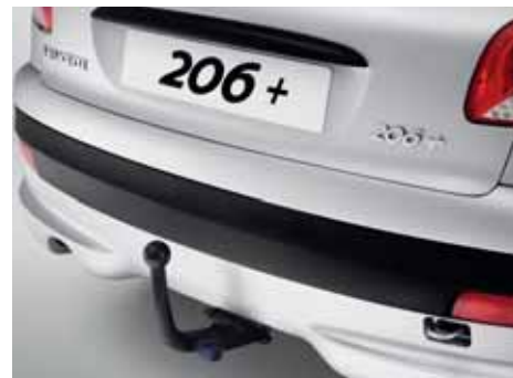
Ťažné zariadenia Vo viacerých prevedeniach.