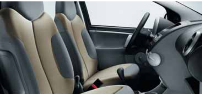
Lákový potah Nokimate béžový Sable