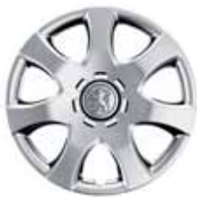
Zlatinové disky kolies Cordouan