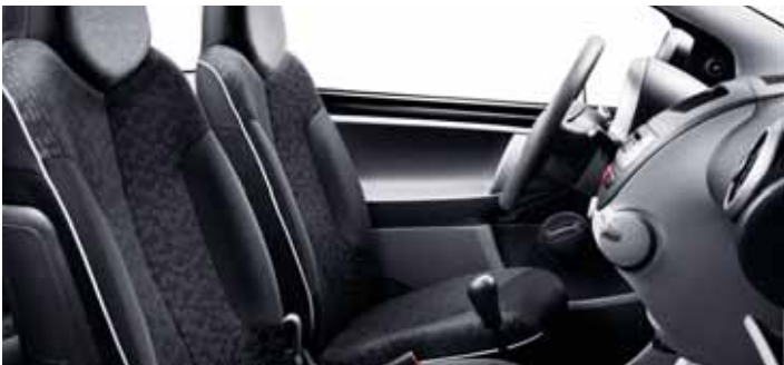
Látkový potah Stilada Mistral / Bise