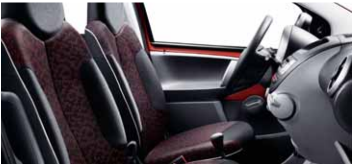
Látkový potah Stilada Mistral / Orange