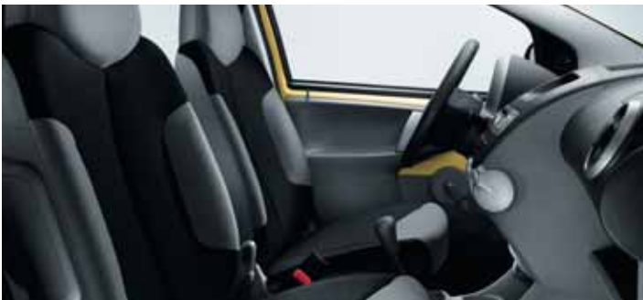
Lákový potah Nokimate čierny Mistral